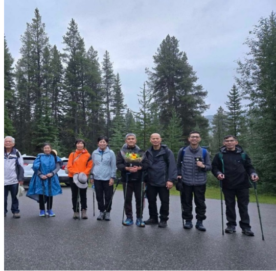
Thành viên của Hội TBPS chuẩn bị đi lên đạo tràng để đánh lễ Đức Văn Thù Bồ Tát

Sáng ngày 17 tháng 8 năm 2024, nhóm anh chị em TBPS gồm 10 người từ Hoa Kỳ và 4 anh chị em tại địa phương (Canada) gặp mặt tại chân núi Castle Mountain chuẩn bị đi bộ lên núi đến đạo tràng của Đức Văn Thù Sư Lợi Bồ Tát để đánh lễ và xin Ngài hộ trì cho Pháp hội sắp tới.