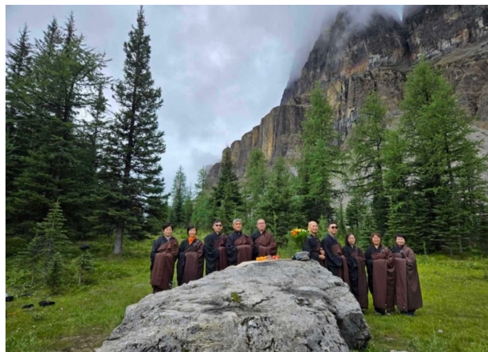
Các anh chị em sau khi dâng lời thỉnh nguyện đến Đức Văn Thù Bồ Tát

Thật cảm động và cảm kích trong chuyến đi Banff lần này, cả nhóm 14 người rất hài hòa, vui vẻ và hỗ trợ cho nhau. Điều quý nhất là ai cũng mở tâm chia sẻ những kinh nghiệm đời và đạo với tất cả chân tình làm cho chuyến đi Thỉnh Thánh tại Banff năm này thật vui nhộn hào hứng. Nhờ vậy, những chướng ngại trên con đường đi đều được hoá giải vô ngại. Tình bạn đạo thêm phần cảm thông và đoàn kết. Nỗi niềm lo âu của thể chất và tinh thần cũng được lành trị và khai thông.