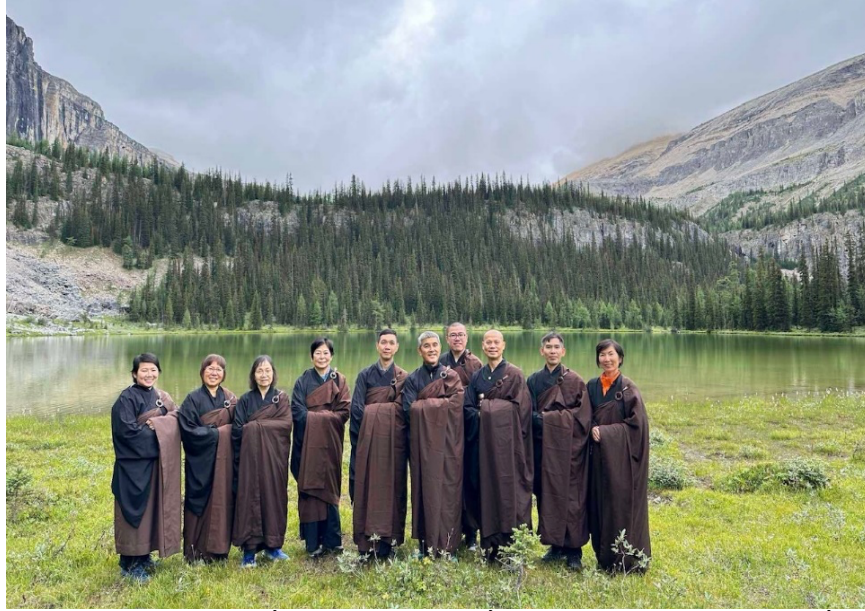
Phái đoàn của Hội TBPS đến từ Hoa Kỳ chụp tấm hình kỷ niệm trước khi rời đất thánh

Sau khi nghi lễ hoàn tất, các anh chị em đã ghi lại bức hình nơi đất thánh. Thay mặt Sư Phụ, và tất cả anh chị em của Hội TBPS, chúng con đã đến đạo tràng thành kính lễ lạy, hoàn thành sứ mạng tâm linh được giao phó. Sau đó đoàn của chúng con xuống núi ra về cùng ngày trong bình an.